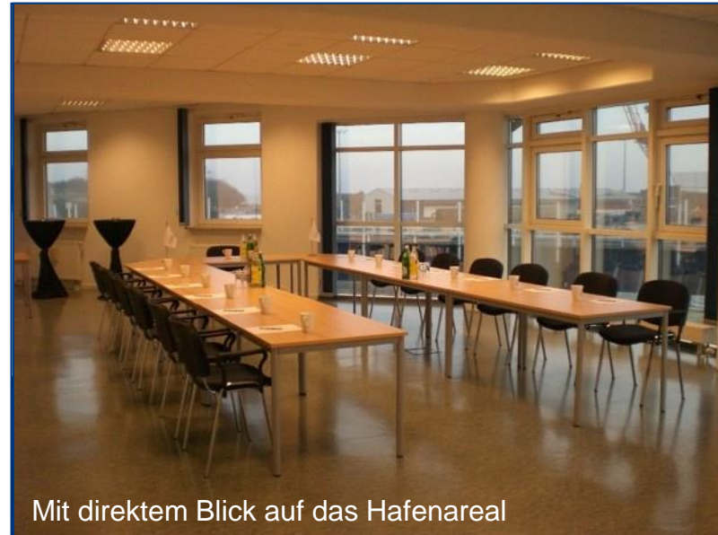
Mit direktem Blick auf das Hafengebiet